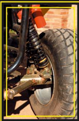
Doble amortiguador en cada rueda trasera