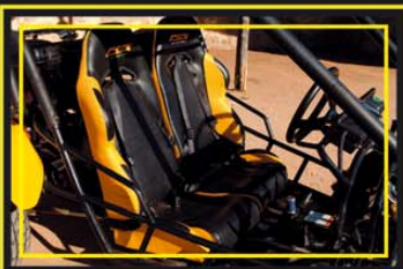
Este biplaza monta chasis tubular de acero