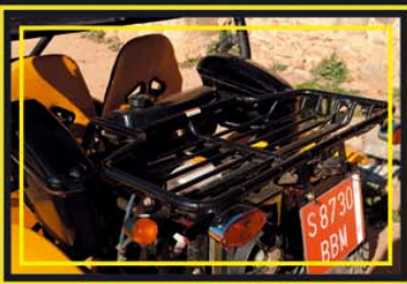
Parrilla de carga situada en su parte trasera