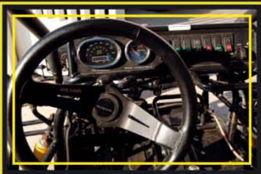
Funcional puesto de conducción