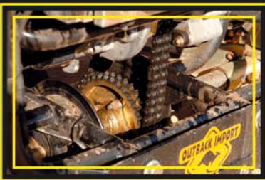
Transmisión por doble cadena