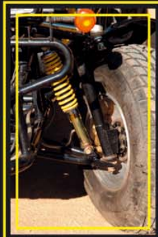
Amortiguadores delanteros de gas de botella separada